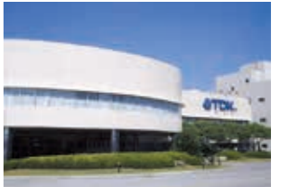
1994年 中国・アモイに現地法人設立