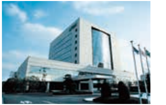
1990年 千葉県にテクニカルセンター完成