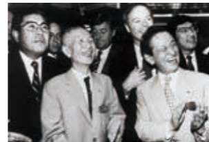
1982年 ニューヨーク証券取引所に上場