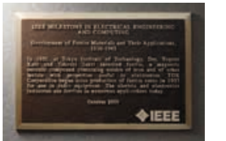
2009年 「IEEEマイルストーン」の銘板