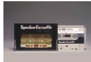
1966年 国産初のカセットテープシンクロカセット