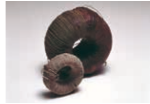
1935年 世界初のフェライトコア

フェライトコアの生産を目的とし、 東京市芝区田村町(現港区)に東京電気化学工業株式会社を設立