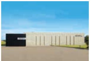
2016年 TDK歴史みらい館リニューアルオープン