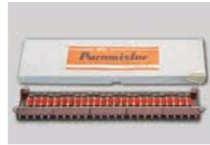
1958年 パラメトロン計算機用メモリコア